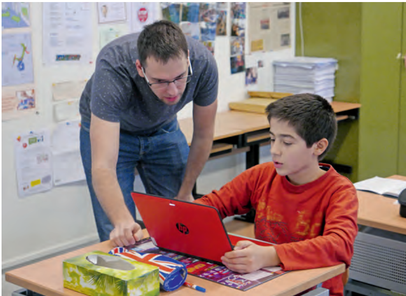
Ajout des définitions dans le Dico des Ados