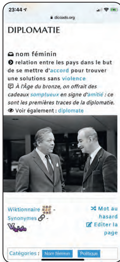
Une définition rédigée et illustrée par les élèves de cette année

MOTS-CLÉS : VOCABULAIRE • FRANÇAIS • MITIC • PER