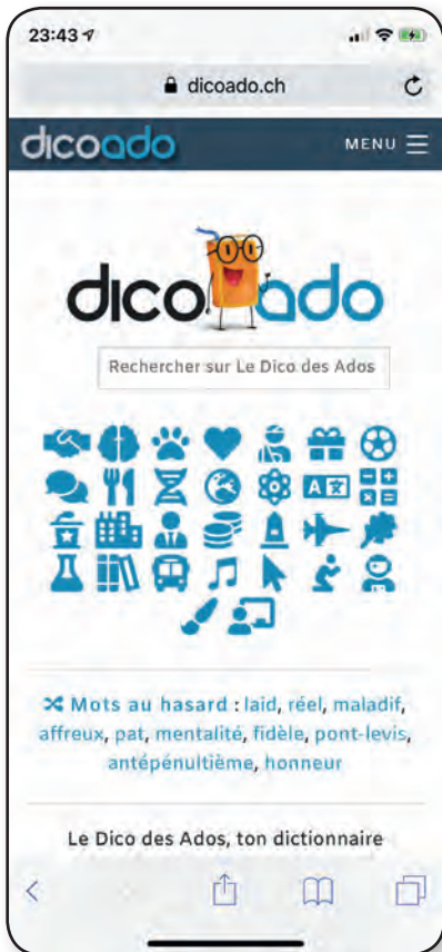
Une page d'accueil très graphique, version téléphone portable